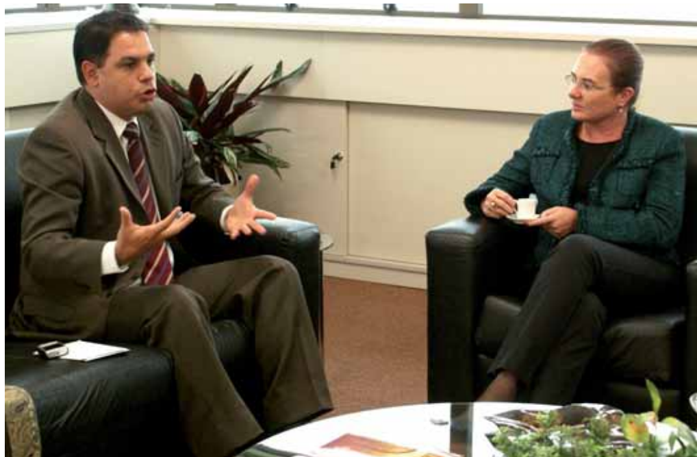
Dornelles levou o assunto ao gabinete da procuradora-geral em junho, pedindo o encaminhamento junto à Assembléia Legislativa

Os exemplos de que promotores têm qualificação e experiência suficientes para desempenhar as funções estão espalhados pelo país. À frente da Conamp, o promotor José Carlos Cosenzo. No Conselho Nacional de Justiça há o paulista Felipe Locke. O corregedor nacional do MP é o catarinense Sandro Neis. E o promotor Leonardo Azeredo Bandarra preside o Conselho Nacional dos Procuradores-Gerais do Ministério Público dos Estados e da União, além de ocupar o cargo de procurador-geral de Justiça no Distrito Federal. Além disso, em 40,7% das unidades da Federação um promotor ocupa o posto de procurador-geral de Justiça. O acesso ao cargo é facultado a todos os integrantes da carreira em 16 Estados, além do Distrito Federal, o equivalente a 63,9%.